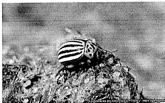
Adult ( Leptinotarsa decemlineata )