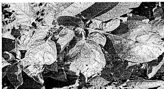
Mana ( Phytophthora i. ).