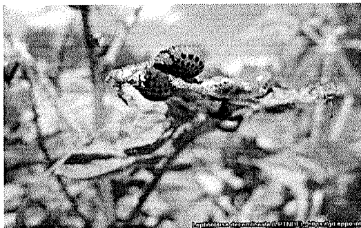
Larve ( Leptinotarsa decemlineata )

Oficiul Fitosanitar Vâlcea, recomandă efectuarea tratamentului fitosanitar la cultura de Cartof , pentru combaterea organismelor dăunătoare Gândacul din Colorado ( Leptinotarsa decemlineata ) + Mana ( Phytophthora i. ).